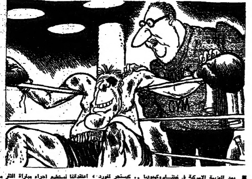
بعد الهزيمة الأمريكية في فيتنام وكوبا... كينجر لورد... اعتدنا نستطيع إجراء جبهة الأمل مع إسرائيل إذا كان هذا بعيد... رسم كاريكاتوري في «هيرالد تريبون»

لها وقد هدأت الأوضاع نسبياً وبدأت الحياة في لبنان تعود إلى طبيعتها، فيمكن التوقف عند بعض محطات كان للوعي الشعبي دور أساسي في ترسيخها. فرغم الآلام والضحايا والخسائر، أكدت الأحداث أن لبنان باق كما كان، موطن الأخوة والتفاهم والتسامح، كما اثبتت الوحدة الوطنية أنها قائمة على أسس راسخة وطيدة، تتأدرة على الصمود في وجه التغيرات من أي باب أتت، وخاصة من باب التخريب الإسرائيلي. لقد كانت تجربة مؤلمة، ولكن لبنان اجتازها، كما في كل مرة، قويا معاني، وسنكون بلا شك دائما في مزيد من التفاهم والتضامن، بعدما أنضج للجميع ان الانقسام لا يجلب سوى الخراب. وقد عبر الطلق الذي أبداه العالم العربي آزاء الأحداث الدامية، عن ضرورة أن يبقى لبنان النافذة المطلقة على العرب والعالم، وأن يبقى صوت القضية الفلسطينية المحوي في الحاضل الدولية. لبنان هذا، يجب أن يبقى تلك الظاهرة الإنسانية الرائعة التي تنضوي تحت جناحها الطوائف والعقائد والأيديولوجيات، ليبقى بالتالي تلك القبة التي تعجز إسرائيل عن سفلتها، لتتشعل التعايش الإنساني والطاقني فيه، المهدي لمصريتها وتمسبها الديني.